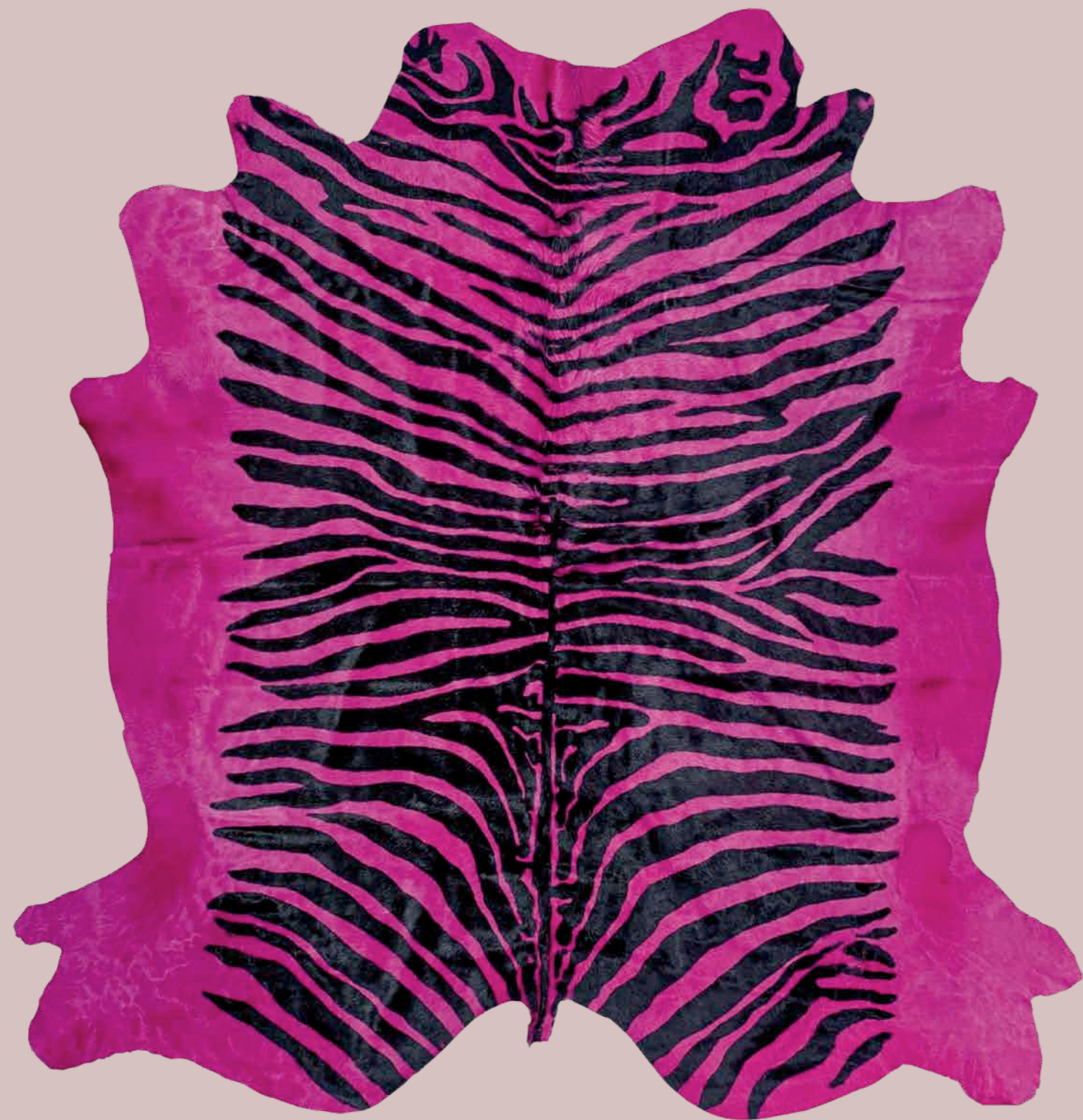
Pelle Zebra Fuxia