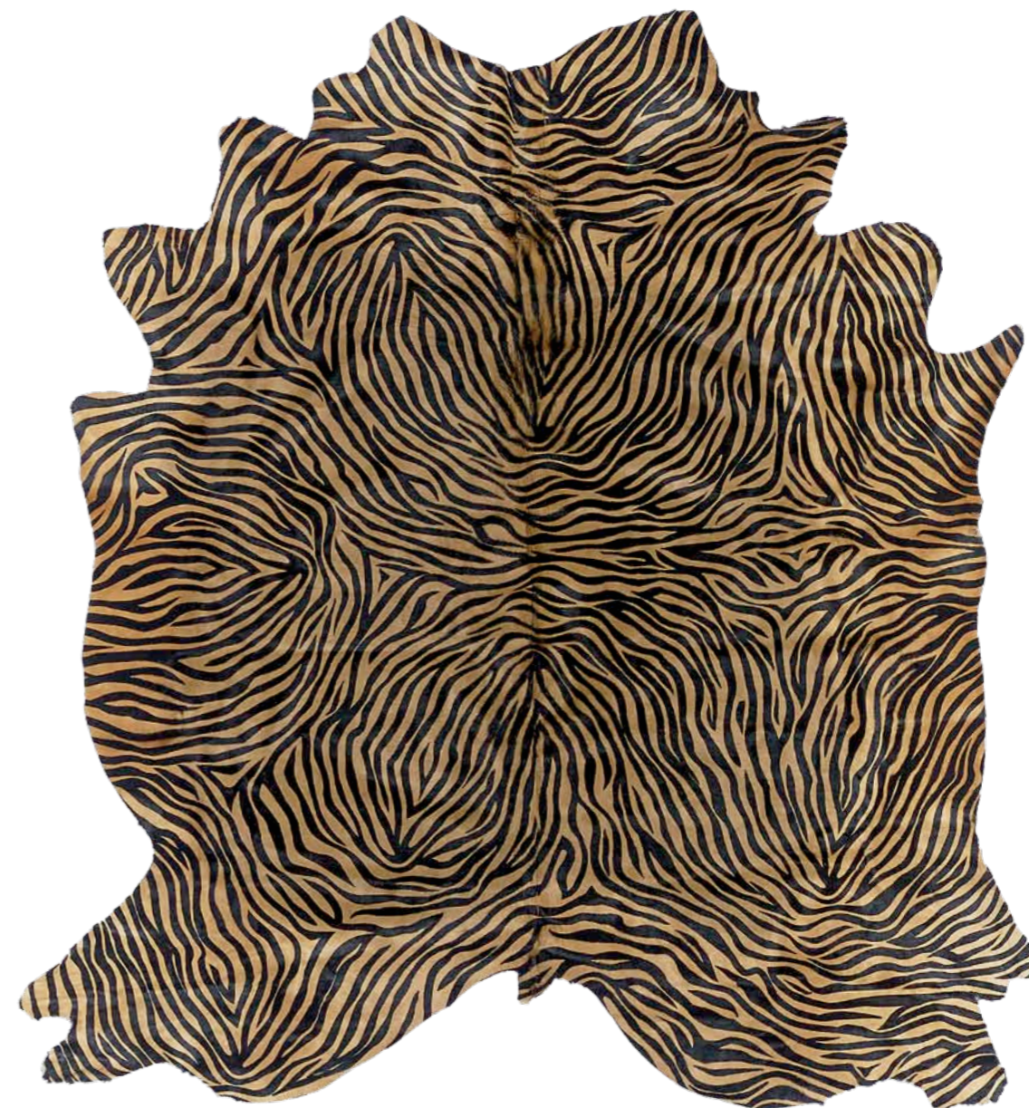
Pelle Zebra Maxi Champagne